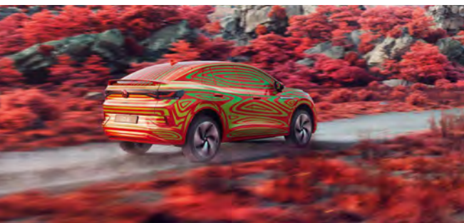
Getarnte seriennahe Fahrzeugstudie

Rückführung des unreparierten Fahrzeugs vom Schadenort zum autorisierten Servicepartner am Wohnort des Fahrers bzw. beim von ihm gewählten autorisierten Servicepartner, falls es nicht innerhalb von drei Werktagen repariert werden kann. Diese Entscheidung im Sinne einer Fahrzeugrückführung aus dem Ausland sowie die Kostenübernahme hierfür müssen vorab vom Call Center freigegeben werden.